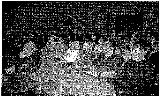
La primera charla reunió el jueves a numerosos oyentes.