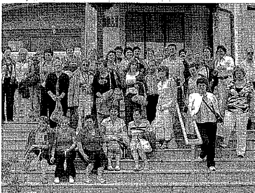
Grupo de socias de Iratzarri en una de las últimas salidas el curso.