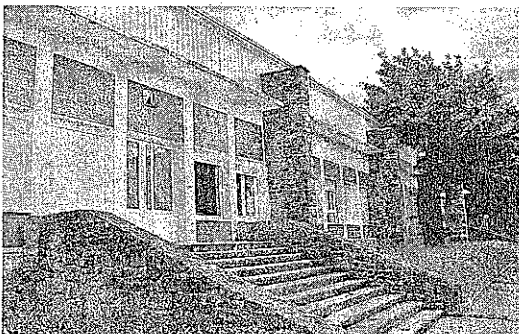
Exterior del edificio actual, situado en el barrio San Juan. [LIMIA]

corresponderían al Consorcio Haurreskolak, formado por el Gobierno Vasco y los Ayuntamientos de cada localidad.