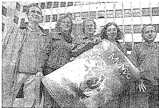
Actores de 'En el mundo a cada rato' que se proyectará en este ciclo.

gráfica sobre las mujeres en Senegal, que se expondrá en el centro social entre los días 19 y 23 de mayo, así como la emisión y coloquio de tres películas ( En el mun-