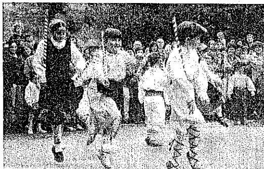
Dantzari txikis de Sustraiak el pasado domingo en Mirandaola.

LEGAZPI DV. La temporada de primavera sigue regalando numerosos momentos de baile y colorido en las calles. Hoy la cita será con los dantzari txikis de Sustraiak. El grupo dará cuenta de todo lo aprendido a lo largo del curso en el festival previsto a partir de las 5.00 de la tarde en la plaza Euskal Herria. Será un buen momento para conocer las evoluciones de las pequeñas promesas locales, entre las que puede encontrarse alguna de las futuras ganadoras del campeonato de Euskadi de