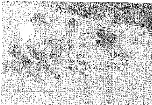
Automodelismoko aurkezpen eta karnioien lasterketa Zumarragan. MEREDIZABAI

Legazpi Duela bi urte sortu zuten elkarteak, baina orain legazpiarrei aurkeztu nahi diete Ekainean bilera baterako deia egingo dute