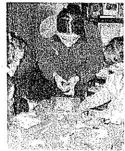
Taller de de dibujos con chapas

El acceso al Museo de las Abejas Aikur también será gratuito, con un taller de elaboración