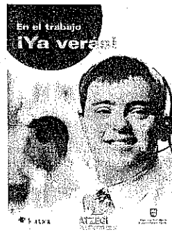
Cartel de la campaña de Atzegi.

Por otro lado, cientos de personas celebrarán este sábado el Txolarte Eguna, cuya organización corresponde este año a Beasain. Socios y monitores de todos los clubes de tiempo libre de Gipuzkoa se darán cita en Ordizia