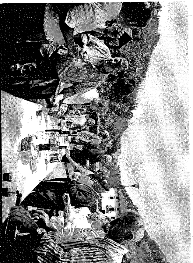
Grandes y pequeños disfrutaron ayer a mediodía de un lunch, tras el que tocó mostrar habilidades en las tiradas de toka.

rrero que se visualiza como base de la vida de aquel colectivo. El ferrón parecía empezar y acabar en la ferretería. — Usted ha querido romper con esa idea. — He querido ampliar este horizonte y presentar a los ferrones como hombres aferrados a la vida de su