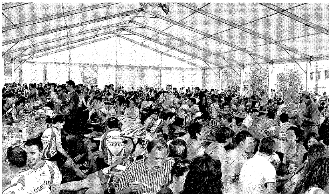
SABIÑÁNIGO COLAPSADO. El pueblo se vio desbordado por miles de cicloturistas.