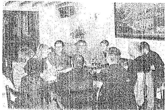
Una de las últimas reuniones de la organización en Brinkola

Desde que el 15 de octubre de 1989, Legazpi acogiera la XVI asamblea y marcha nacional de