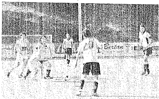
Han empatado 2 de los 4 partidos jugados hasta ahora. ALIMIA

La segunda parte fue de total y absoluto dominio del Hinxta, que empataba el partido para el minu-