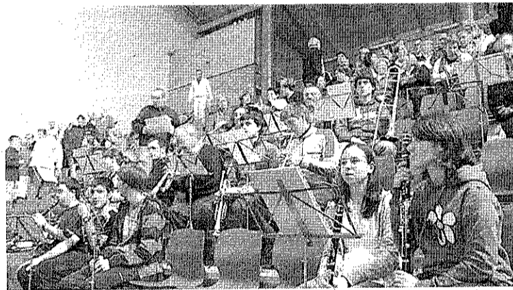
Legazpiarrek buru-belarri dabilta jaialdirako entseguetan.

Legazpiarrek dena prest izan nahi dute larunbat honetan ospatuko duten jaialdi handiari begira. Horretarako, azken egunetan hainbat entsegu eta saio egiten ari dira le-