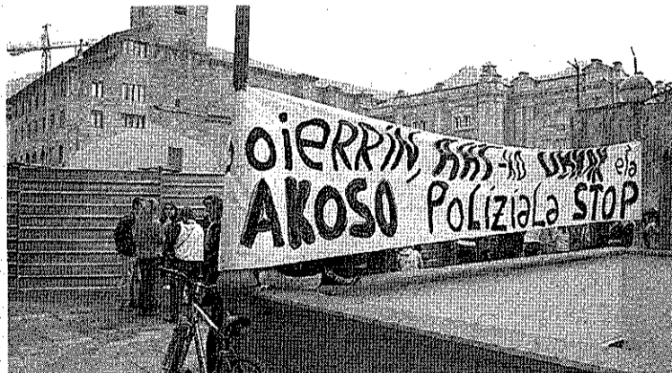
Protesta egin zuten atzo Tolosako epaitegiaren aurrean.

Atzoko epaiketaren aurretik elkarretaratzea egin zuten ehundik gora gazteek Tolosako epaitegiarean, Goierriko hiru ikastetxetan