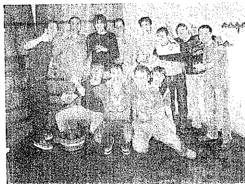
Jugadores técnicos y aficionados en la última cena del equipo