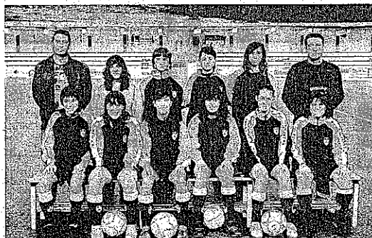
Las cadetes de FB terminarán la Liga ganando al Euskalduna por 3-2.

20 minutos un partido que estuvo a punto de remontar en la segunda parte pese, a irse al descanso con un marcador de 0-3 en contra. Los de Charli y Lizarazu conseguían acortar distancias en la segunda mitad poniéndose a tan