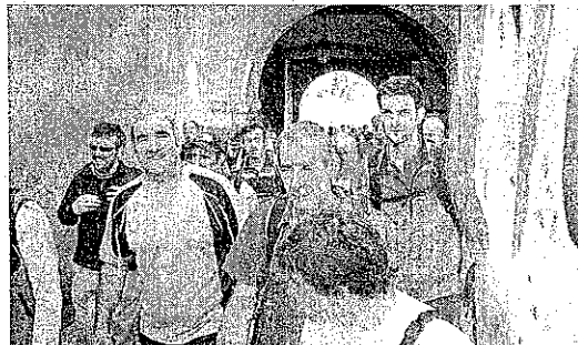
Foto de la marcha Legazpi-Segura tomada por Izadi Zaleak

Por otro lado, el grupo hace un magnífico balance de la marcha Legazpi-Segura agradeciendo la colaboración de los Ayuntamientos de Zerain y Segura. La expedición partió el domingo a las 8.00 desde Izadi Zaleak: «Tan pronto llegamos a Motxoro tomamos el antiguo camino que pocos conocían, siendo una agradable sorpresa, pese a encontrar en algún punto escombros», relatan desde la sociedad. «Desde aquí nos dirigimos hacia Aztiria y almorzamos en el 'barco', con un ambiente extraordinario. Después continuamos hacia Zerain por el antiguo itinerario, donde queremos resaltar la grandísima labor de limpieza realizada por el Ayun-