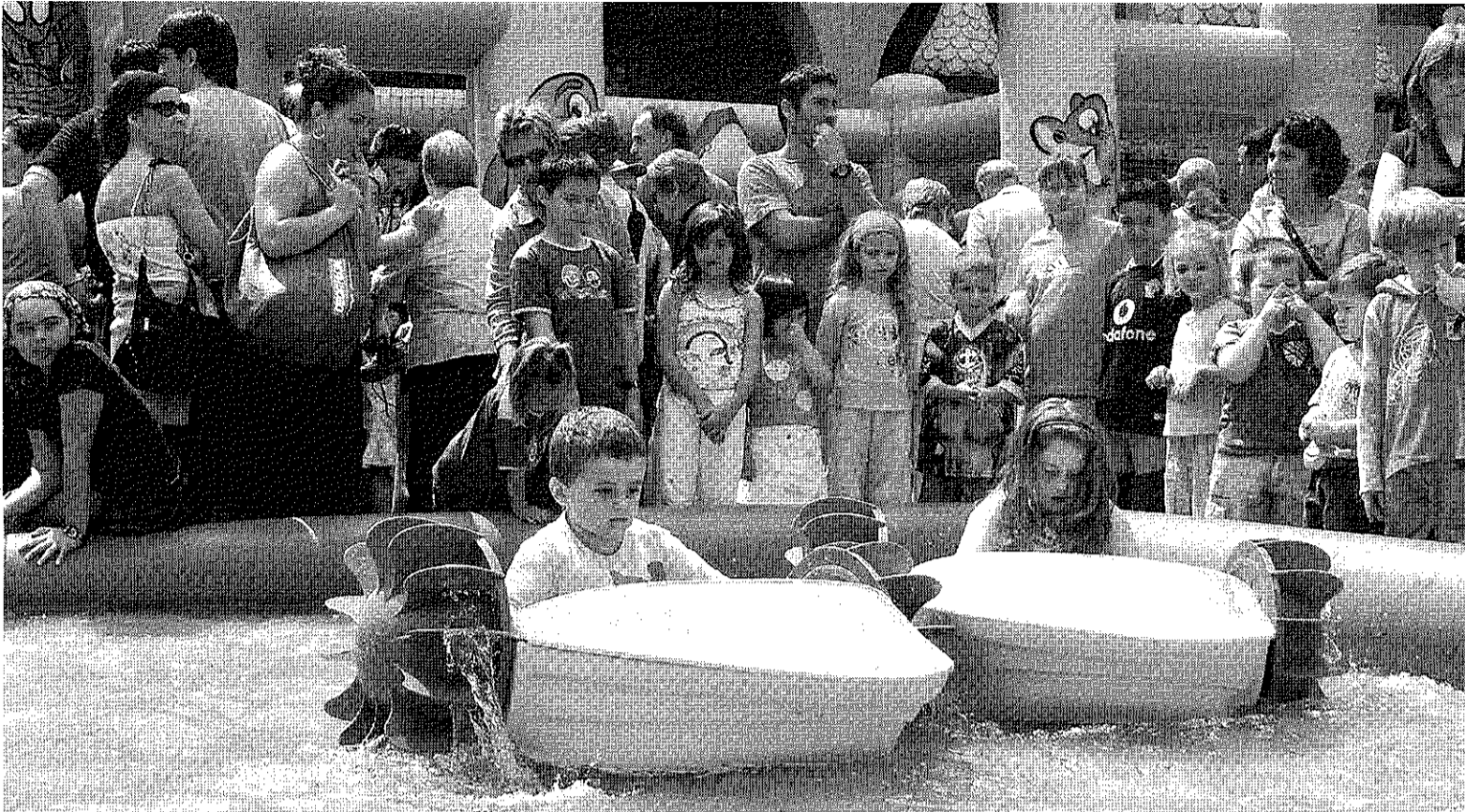
Los niños juegan en el parque infantil instalado en la plaza Euskadi.