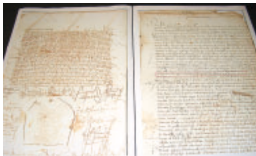
Legazpi hiriarren sorrerako idatziak eta planoak, liburu zaharretan. E. LEGORBURU

Erakusketa » Eskuizkribuz osatutako bilduma Kultur Etxeko erakusketa aretoan egongo da ikusgai irailaren 12tik urriaren 10era.