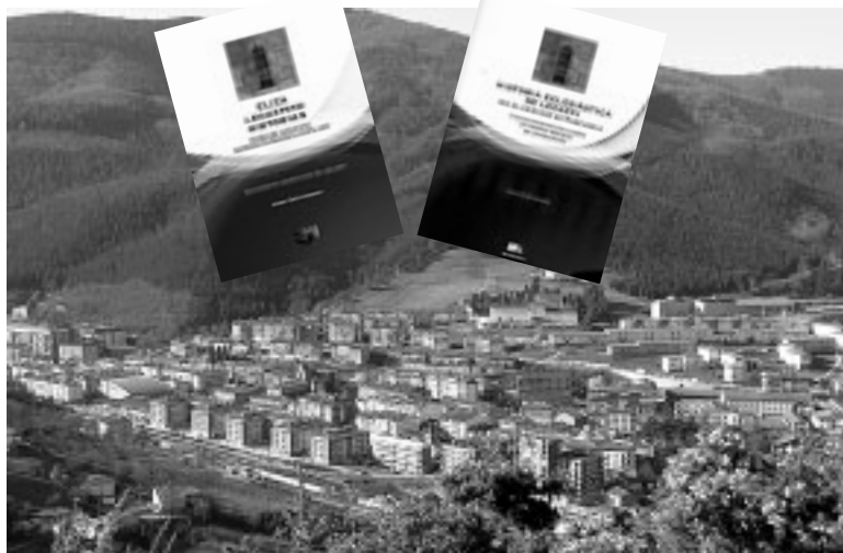
Legazpi herrigunearen ikuspegi orokorra, goian liburuaren bi aldaeren azalekin.

Liburu, 310 orrialdekoa, zortzi kapitulu banatuta dago, eta elizarekin zerkusia duten hainbat gertakari ukitu eta lantzen ditu. Euskaraz eta gaztelaniaz badago ere, euskarazko testuak dauka lehenetasuna. Aurkezpena irailaren 11n da, kultur etxean, 19:00etan.