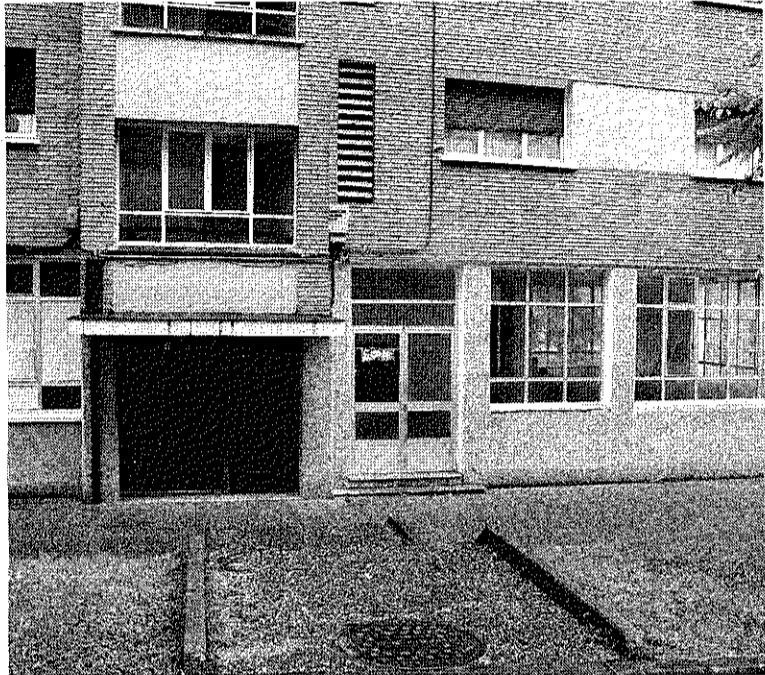
NUEVA GUARDERÍA. Se situará en Itxaropen, 15-16. /LIMIA

Ante esta situación, el departamento de Educación del Ayuntamiento llevó a cabo un sondeo para pulsar el grado de necesidad en torno a la haurreskola. En mayo, se enviaron formularios a todos aquellos padres y madres