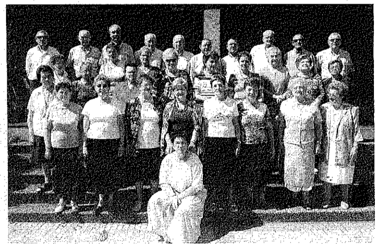
CORO DE BUZINTEGI. También actuará en el evento de hoy.

ros ese mismo día. Aquí entran la comida, la bebida, una camiseta, un vaso plegable y un diploma. La organización aconseja apuntarse antes del 12 de octubre en la sociedad Armuño, el bar Urbeltz, el polideportivo, el Gaztetxe, Izadi Zaleak o por internet en www.izadi-zaleak.com/mendimartxa . ■