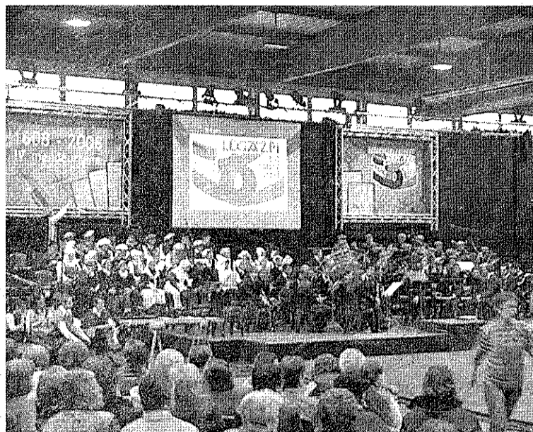
Ia 900 lagun batu ziren kiroldegian ikuskizuna ikusteko. XABIER BARRIOLA