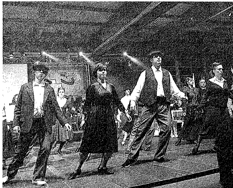
Egokitu zitzaien garaia irudikatu zuten dantzen bidez. ERRIKARTE AGIRRE