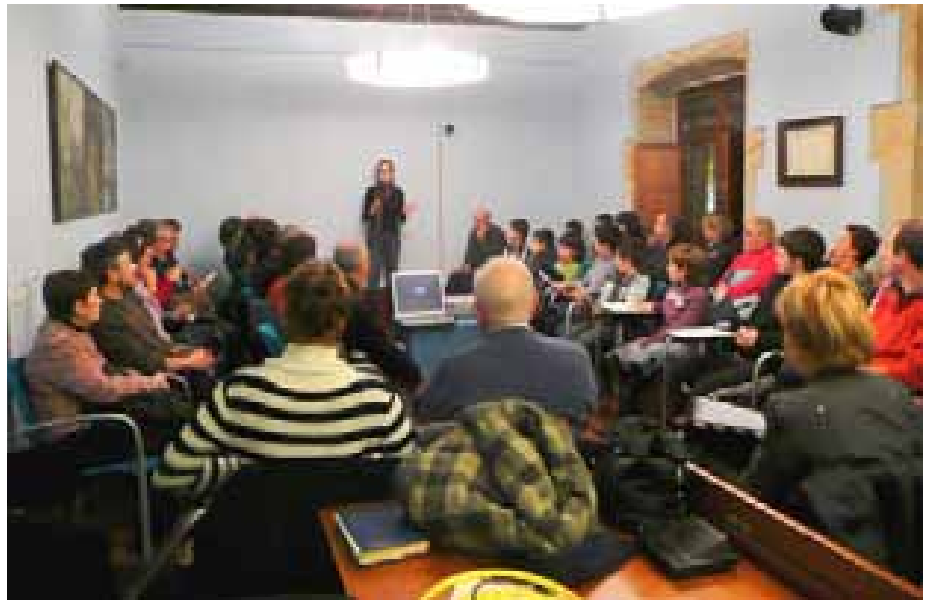
Legazpiar guztien inplikazioa bilatuko du Legazpi BAI!k

En los próximos meses se trabajará con los responsables del proyecto de Cornellá de Llobregat para ver cómo se puede adaptar su modelo de trabajo a Legazpi, aprovechando que Legazpi es más pequeño, que la gente se conoce más y que hay más asociacionismo.