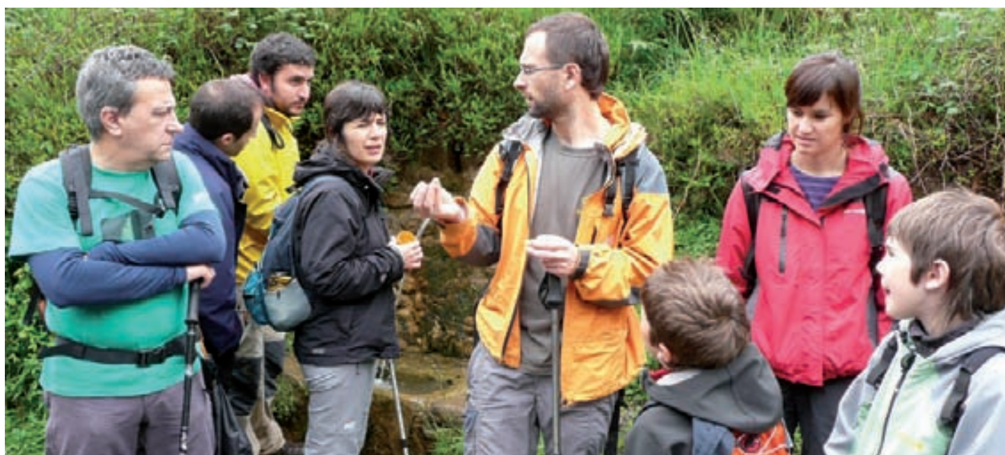
Legazpiarrek adi entzun zituzten Aranzadiko adituen azalpenak

Bestalde, herritarrei gutxien gustatzen zaiena Legazpi sarrerako fabrikak dira.