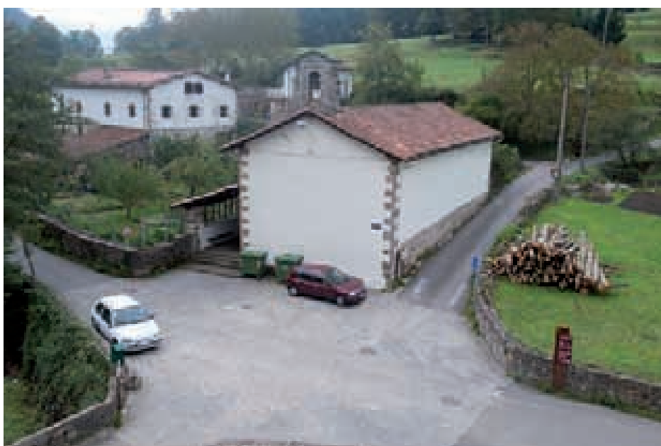
San Joan ermitako plaza

Antes de diciembre Itxaropen contará con diez nuevas plazas de aparcamiento