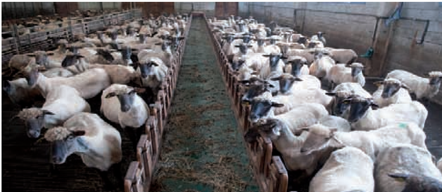
Makatza baserriko ardiak

Abeltzain txikien jarduera babestea da Zubillaga hiltegia aurrera eramateko indarrak batzearen arrazoia