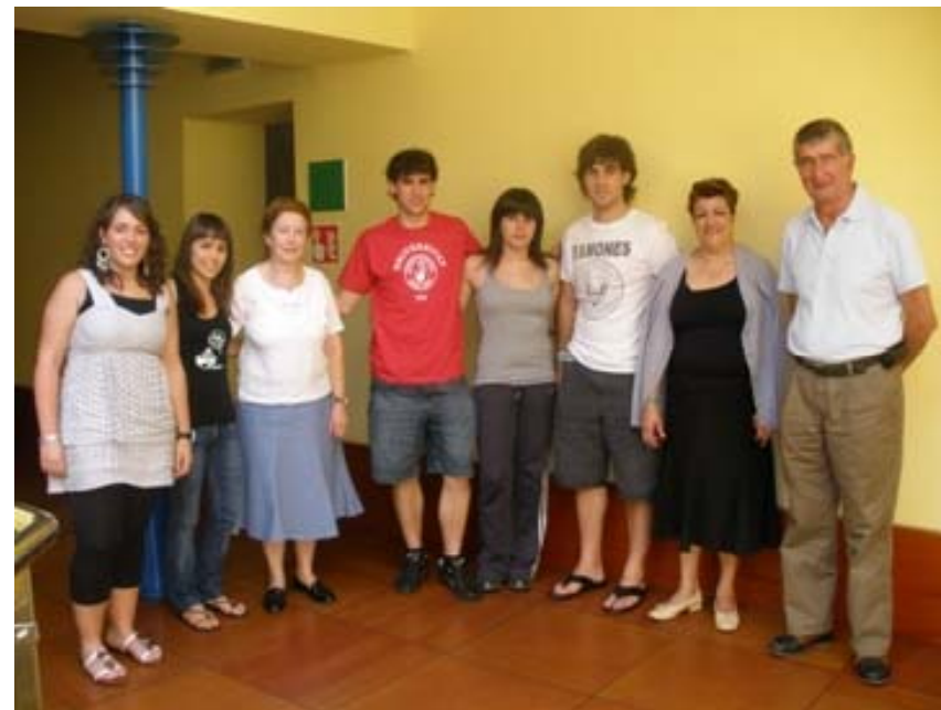
2010eko uztaila: proiektuaren azken ikutuak